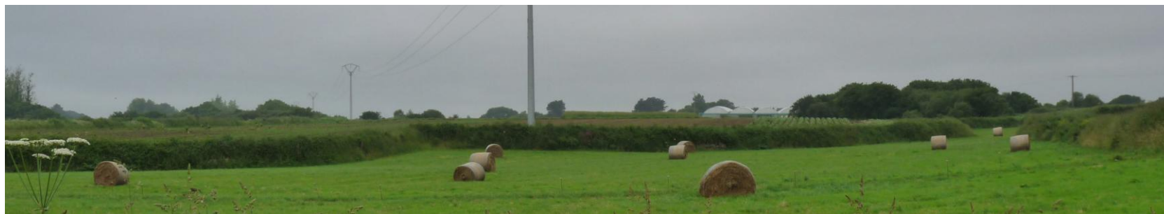
PHOTO DE LOIN